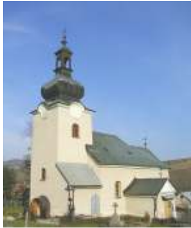
Chrám sv. archanjela Michala

Chrám sv. archanjela Michala je barokovo-klasicistický, postavený r. 1778, reštaurovaný r. 1895, 1933 a 1938, jednolod'ový s polygonálnym uzáverom a predstavanou vežou. Na veži je baroková laternová kupola. Vnútorne zariadenie je z r.1895. V interiéri kostola zaujme bohato zdobený ikonostas.