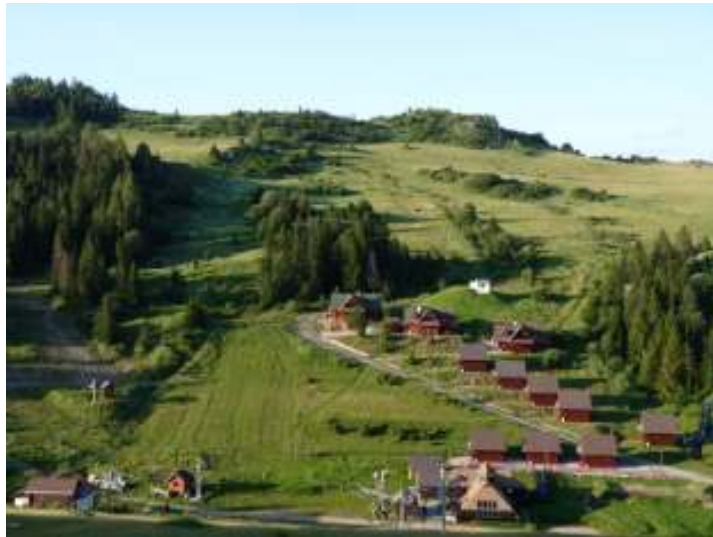
Lyžiarsky areál Skicomp Fakľovka

Lyžiarsky areál Skicomp Fakľovka ponúka rôzne sklony a profily zjazdových tratí v nadmorskej výške od 690 do 920 m. Stredisko s tromi veľkými vlečkami a jedným malým detským vlečkom pre nenáročných lyžiarov. Celková prepravná kapacita 2000 osôb za hodinu. Z hľadiska geografickej polohy je stredisko veľmi výhodne situované vďaka čomu je dostatok snehovej pokrývky počas celého zimného obdobia. Lyžiarske svahy sú umelo zasnežované a osvetlené. Z vrcholu Fakľovky (945 m) je pekný výhľad na okolitú prírodu i Vysoké Tatry. V stredisku je možnosť kompletných stravovacích služieb v štýlovej čajovni goralského typu a bufetu priamo na svahu. Je tu tiež požičovňa lyžiarskeho výstroja a ski-servis. Návštevníci sa môžu ubytovať priamo v lyžiarskom areáli v zrubových chatách.