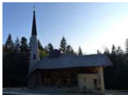
Pútnické miesto Hora Zvir