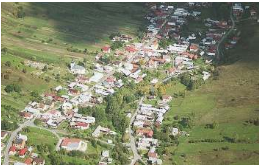
Letecký pohľad na obec Litmanová

Obec bola ako majetok Ľubovnianskeho panstva v zálohu v Poľsku do roku 1772. Roku 1822 sa poddaní vzbúrili proti robotám. Roku 1828 obec mala 162 domov a 1185 obyvateľov - najviac počas svojej existencie. V obci bolo silné vystaňovalstvo. Obyvatelia boli známi drotári a sklári. Po roku 1918 si obec zachovala poľnohospodársko-pasienkársky ráz. Počas SNP obyvatelia podporovali na okolí operujúce partizánske skupiny. Obec bola oslobodená 24. 1.1945. Po roku 1945 bola v obci zavedená elektrická sieť /1960/, miestny rozhlas, verejné osvetlenie a postavená budova Jednoty SD, budova MNV /1958/, kultúrny dom /1978/, kasárne finančnej stráže, požiarna zbrojnica, budova školy /1982/, vodovod /1990/, miestne komunikácie, objekty JRD a ďalšie stavby.