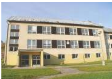
Základná škola s materskou školou