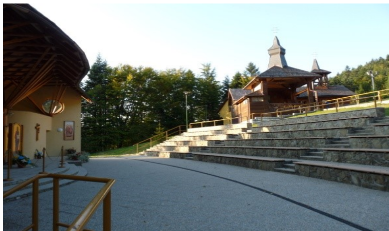
Pútnické miesto Hora Zvir