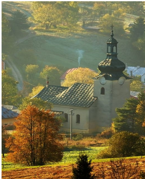
Chrám sv. archanjela Michala

Chrám sv. archanjela Michala je barokovo-klasicistický, postavený r. 1778, reštaurovaný r. 1895, 1933 a 1938, jednoloďový s polygonálnym uzáverom a predstavanou vežou. Na veži je baroková laternová kupola. Vnútorne zariadenie je z r.1895. V interiéri kostola zaujme bohato zdobený ikonostas.