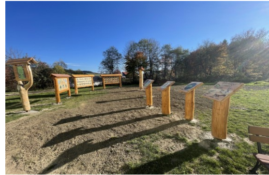
ODDYCHOVÁ-NÁUČNÁ ZÓNA PRE DETI V MŠ