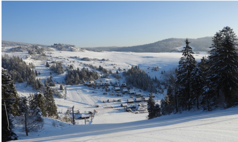
Lyžiarsky areál Skicomp Fakľovka

osvetlené. Z vrcholu Fakľovky (945 m) je pekný výhľad na okolitú prírodu i Vysoké Tatry. V stredu je možnosť kompletných stravovacích služieb v štýlovej čajovni goralského typu a bufetu priamo na svahu. Je tu tiež požičovňa lyžiarskeho výstroja a ski-servis. Návštevníci sa môžu ubytovať priamo v lyžiarskom areáli v zrubových chatách.