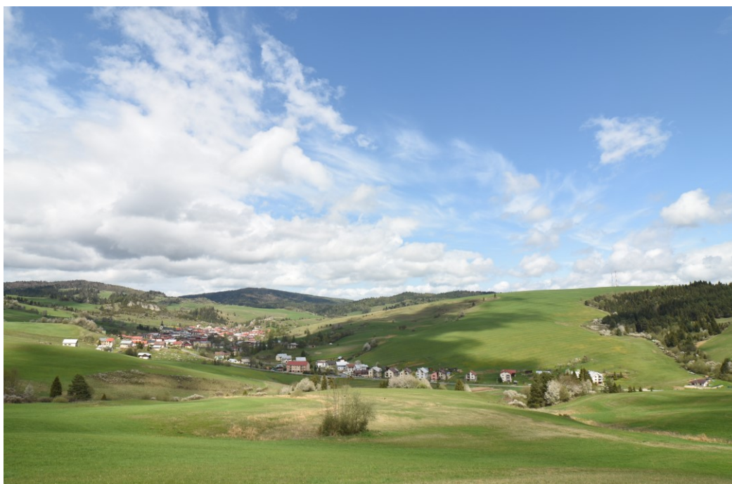
Pohľad na Obec Litmanová

Obec bola ako majetok Ľubovnianskeho panstva v zálohu v Poľsku do roku 1772. Roku 1822 sa poddaní vzbúrili proti robotám. Roku 1828 obec mala 162 domov a 1185 obyvateľov - najviac počas svojej existencie. V obci bolo silné vyst'ahovalectvo. Obyvatelia boli známi drotári a sklári. Po roku 1918 si obec zachovala poľnohospodársko-pasienkarský ráz. Počas SNP obyvatelia podporovali na okolí operujúce partizánske skupiny. Obec bola oslobodená 24. 1.1945. Po roku 1945 bola v obci zavedená elektrická sieť /1960/, miestny rozhlas, verejné osvetlenie a postavená budova Jednoty SD, budova MNV /1958/, kultúrny dom /1978/, kasárne finančnej stráže, požiarna zbrojnica, budova školy /1982/, vodovod /1990/, miestne komunikácie, objekty JRD a ďalšie stavby.