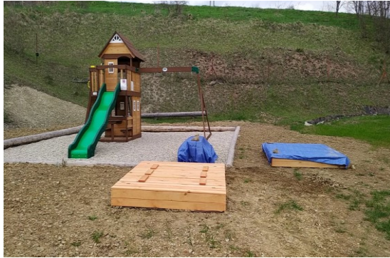
Detské ihrisko pri MŠ