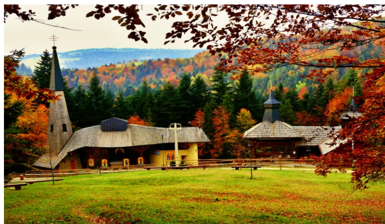
Pútnické miesto Hora Zvir