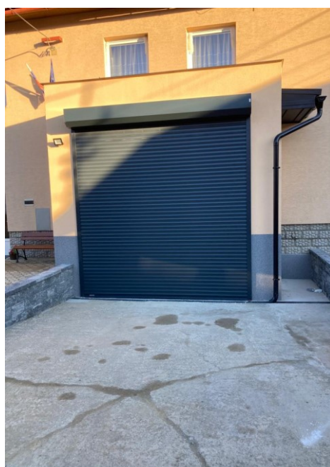
„Stavebné úpravy hasičskej zbrojnice v obci Litmanová“ v roku 2022