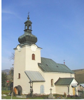
Chrám sv. archanjela Michala