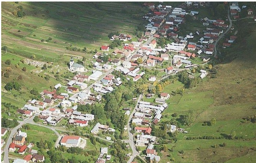
Letecký pohľad na Obec Litmanová

Obec bola ako majetok Ľubovnianskeho panstva v zálohu v Poľsku do roku 1772. Roku 1822 sa poddaní vzbúrili proti robotám. Roku 1828 obec mala 162 domov a 1185 obyvateľov - najviac počas svojej existencie. V obci bolo silné vyst'ahovalectvo. Obyvatelia boli známi drotári a sklári. Po roku 1918 si obec zachovala poľnohospodársko-pasienkársky ráz. Počas SNP obyvatelia podporovali na okolí operujúce partizánske skupiny. Obec bola oslobodená 24. 1.1945. Po roku 1945 bola v obci zavedená elektrická sieť /1960/, miestny rozhlas, verejné osvetlenie a postavená budova Jednoty SD, budova MNV /1958/, kultúrny dom /1978/, kasárne finančnej stráže, požiarna zbrojnica, budova školy /1982/, vodovod /1990/, miestne komunikácie, objekty JRD a ďalšie stavby.