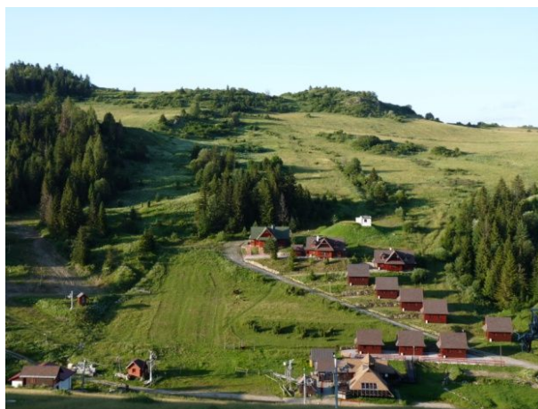
Lyžiarsky areál Skicomp Fakľovka

Lyžiarsky areál Skicomp Fakľovka ponúka rôzne sklony a profily zjazdových tratí v nadmorskej výške od 690 do 920 m. Stredisko s tromi veľkými vlekmí a jedným malým detským vlekom pre nenáročných lyžiarov. Celková prepravná kapacita 2000 osôb za hodinu. Z hľadiska geografickej polohy je stredisko veľmi výhodne situované vďaka čomu je dostatok snehovej pokrývky počas celého zimného obdobia. Lyžiarske svahy sú umelo zasnežované a osvetlené. Z vrcholu Fakľovky (945 m) je pekný výhľad na okolitú prírodu i Vysoké Tatry. V stredisku je možnosť kompletných stravovacích služieb v štýlovej čajovni goralského typu a bufetu priamo na svahu. Je tu tiež požičovňa lyžiarskeho výstroja a ski-servis. Návštevníci sa môžu ubytovať priamo v lyžiarskom areáli v zrubových chatách.