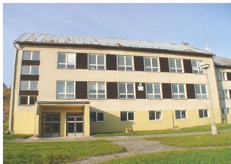
Základná škola s materskou školou

V súčasnosti výchovu a vzdelávanie detí v obci poskytuje len materská škola. V základnej škole od 1.9.2013 neprebíhal vyučovací proces a k 31.8.2014 bola základná škola s materskou školou vyradená zo siete škôl. Do siete škôl bola k 1.9.2014 zaradená materská škola bez právnej subjektivity a školská jedáleň.